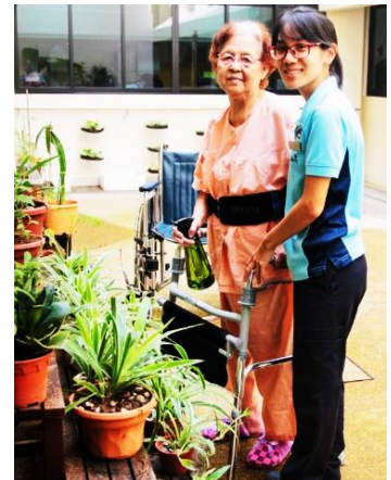
特别设计的失智病房内有庭院，为患者和看护人提供了宾至如归的感觉。