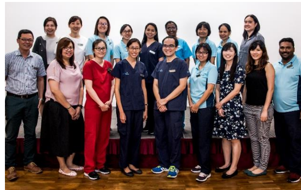
多学科失智症护理团队为病人提供生理，心理和社会辅导的全方位护理。